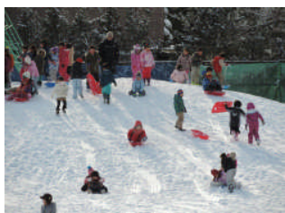
〈元気いっぱいの2年生〉

根雪とまではいかなかったものの、この日を待ちに待った子どもたちは、歓声とともに外へ飛び出しました。