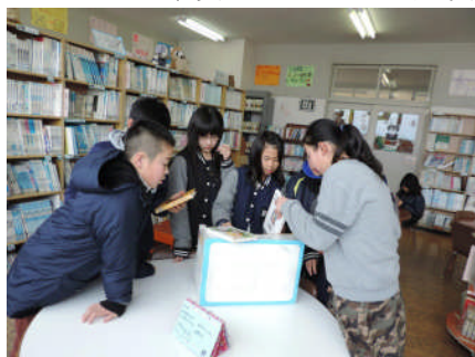
「これがいいね。」本を選定する4年生 ようです。

そして、今年度から始まった読み聞かせボランティアの方々のお話に耳を傾ける子どもたちは、時には笑いながら、ときには引き込まれながら、想像の〈子どもたちに好評の読み聞かせ〉世界を堪能しています。季節や行事にちなんだテーマのもとにお話を繰り広げてくださる工夫も、とてもうれしいことです。