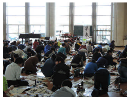
〈一画、一画、真剣に、心を落ち着かせながら…〉

今は万能な墨滴が開発されて、すぐに筆を動かせませんが、「水」から墨をすりあげていたときのことを覚えている私のような世代にとっては隔世の感があります。それでも、書きぞめに向かう姿には、少しも変わるところがありません。写真は5年生ですが、集中しての取組に張り詰めた空気が漂い、心地よい緊張感があります。この様子は、かつてと全く同じで、いわゆる「不易と流行」という言葉が浮かびます。時代は移っても、人の心の中にある真摯な姿は変わらず尊いものです。来月22日から掲示される作品。学習参観時に、是非ご覧いただきたいと思ひます。